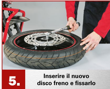
5. Inserire il nuovo disco freno e fissarlo