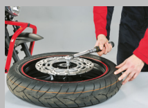
5. Mettere il disco nuovo e serrare le viti di fissaggio.