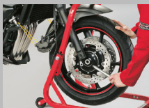
1. Sollevare la motocicletta e rimuovere la pinza freno.