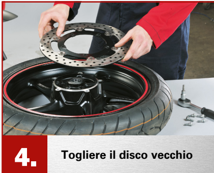
4. Togliere il disco vecchio