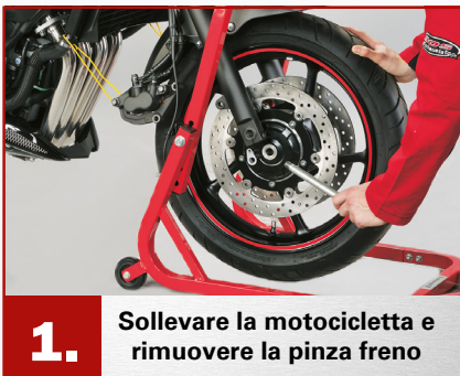
1. Sollevare la motocicletta e rimuovere la pinza freno