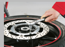
3. Allentare le viti di fissaggio del disco.