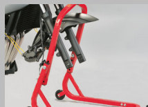
2. Rimuovere il perno della ruota e togliere la ruota.