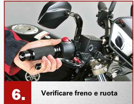
6. Verificare freno e ruota

5. A questo punto, inserire i nuovi dischi freno TRW-Lucas. Serrare le viti di fissaggio con la coppia di serraggio predefinita, agendo in modo incrociato, come indicato dal costruttore del mezzo. Viti di fissaggio fortemente corrose o danneggiate vanno sostituite.