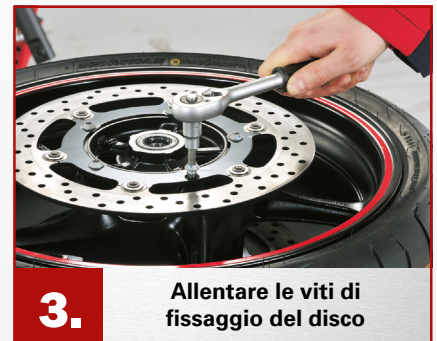
3. Allentare le viti di fissaggio del disco