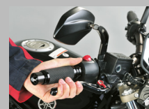
6. Verificare il punto di pressione del freno e che la ruota giri liberamente. Pulire il disco freni.