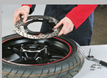
4. Togliere il disco vecchio e pulire la superficie di appoggio.