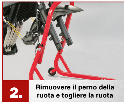
2. Rimuovere il perno della ruota e togliere la ruota