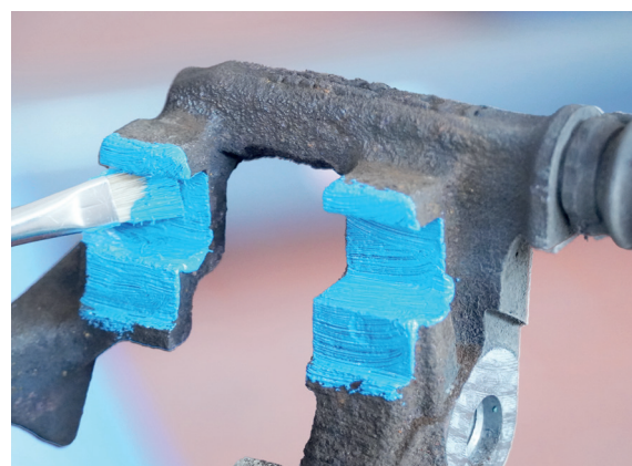
Support d'étrier traité avec NOxidation

NOxidation assure une lubrification efficace des supports d'étriers. Ceci est essentiel pour garantir un mouvement uniforme et sans résistance des plaquettes de frein. Un support d'étrier bien lubrifié empêche tout frottement indésirable entre les plaquettes et le disque de frein lors du desserrage du frein et contribue ainsi non seulement à améliorer le confort de conduite, mais réduit également l'usure des autres composants des freins.