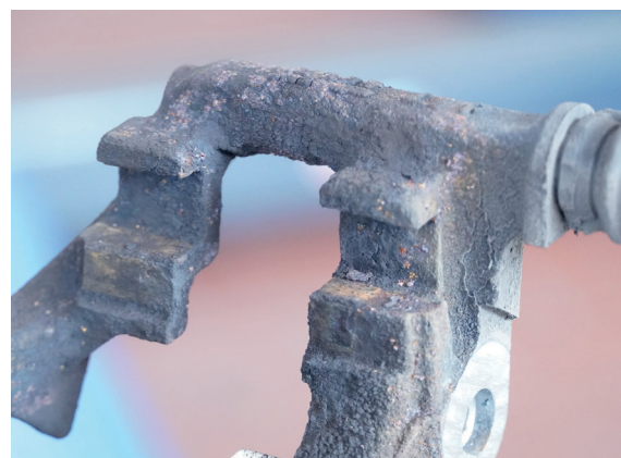
Support d'étrier corrodé

NOxidation forme ici une barrière protectrice qui empêche la pénétration d'humidité et de saleté et prolonge ainsi considérablement la durée de vie des composants.