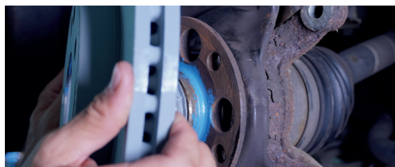
NOxidation pour une meilleure liberté de mouvement